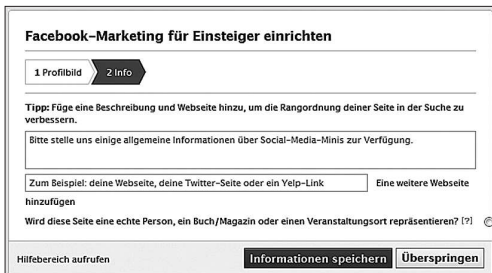
Abbildung 3.7: Screenshot Kurzbeschreibung