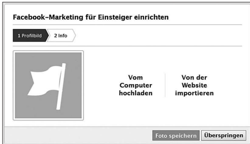
Abbildung 3.6: Screenshot „Profilbild hinzufügen“